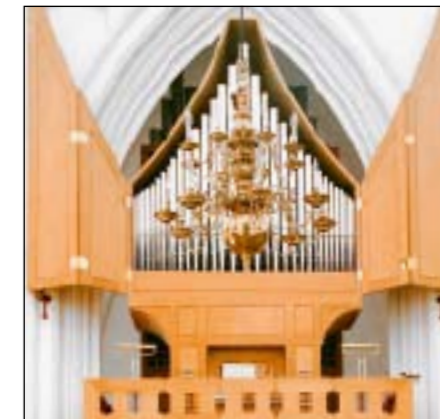
Kororglet i Domkirken

er det den første søndag i advent. I Graabrødre Klosterkirke kl. 17.00 medvirker en sangsolist.