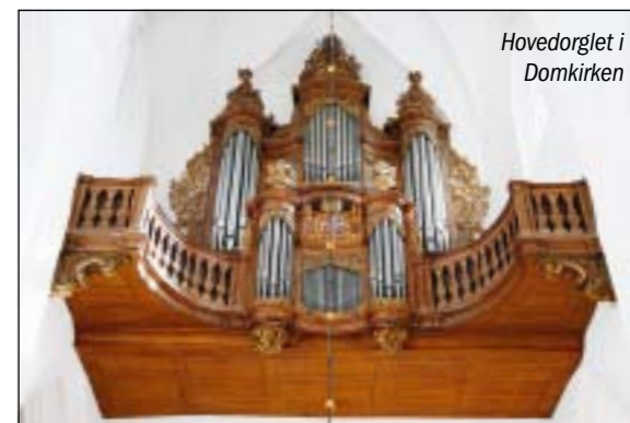
Hovedorglet i Domkirken

Kirkemusikeren leder salmesangen mv. med intens brug af sin medleven og sin kirkemusikalske og liturgiske indsigt og for undertegnede har afstanden intet at sige, da afstanden jo er en naturlig følge af rummets størrelse. Jeg ånder stadigt sammen med menigheden.