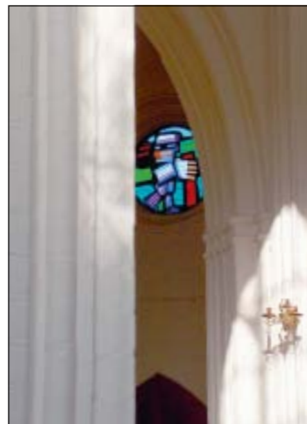
Vandringsmanden i Domkirken