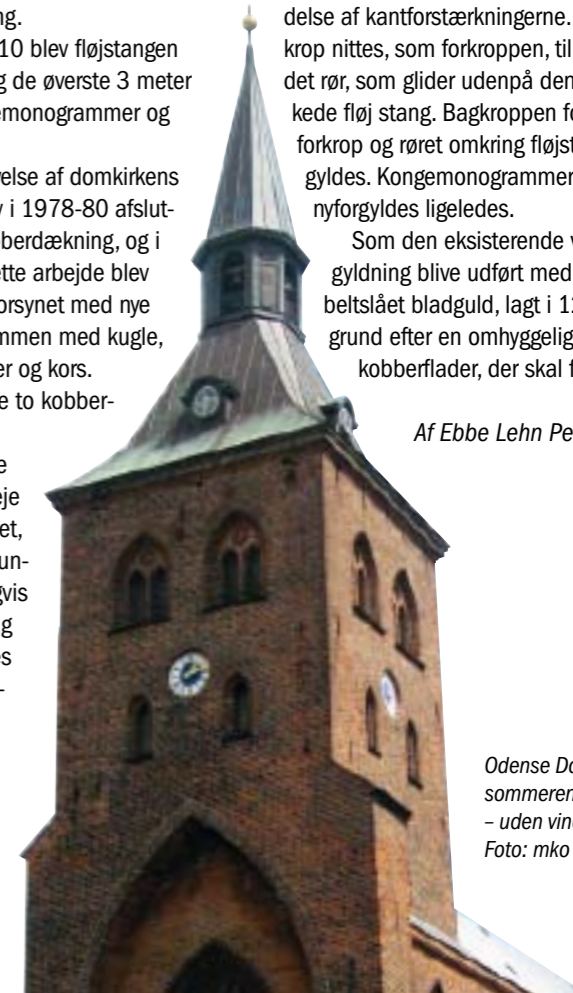
Odense Domkirke sommeren 2010 – uden vindfløj.