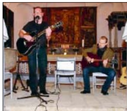
Brothers of Mercy

"Brothers of Mercy" vil spille fra lidt over kl. 20 og vil indgå i Natkirkens øvrige program med nadverandagt i krypten kl. 22 og aftenbøn kl. 23.30. Dvs. der ikke er tale om en koncert i gængs forstand, med bifald, men om en lydbaggrund for roen og fordybelsen i Natkirken, hvor man kan læne sig tilbage og nyde musikken og ordene.